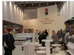
Marabu auf der Fespa Digital 2011

Im Digitaldruck liegen zunehmend Lösungen für den Direktdruck im Trend. Marabu launcht eine neue 2 in 1 Hybrid Sublimationsfarbe, die auch für den Direktdruck geeignet ist.