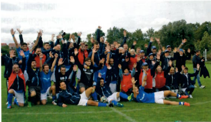
Die Gewinner des Esma-Fußballturniers

Sechs Siebdruckunternehmen nahmen am Fußballturnier der Esma im September teil: Marabu aus Deutschland, Fimor aus Frankreich, Lechler und Saati aus Italien, Macdermid aus Großbritannien und Sefar aus der Schweiz. Nach sechzehn Runden war es das Team der Firma Lechler,