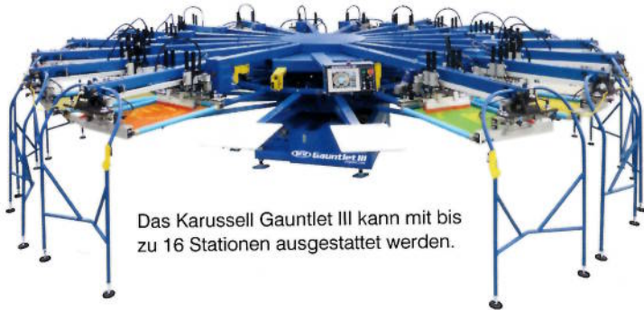
Das Karussell Gauntlet III kann mit bis zu 16 Stationen ausgestattet werden.

M&R hat das automatische Siebdruckkarussell Gauntlet III neu im Portfolio. Es ist mit 10 bis 16 Stationen bei einer maximalen Standardbildfläche von 48 mal 55 Zentimetern erhältlich. Die Siebe werden elektrisch