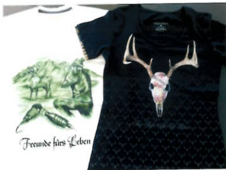
Promotexx ist mit seinen Textilien in Hamburg nun vor Ort. (Motive designed von www.andrezechmann.com )