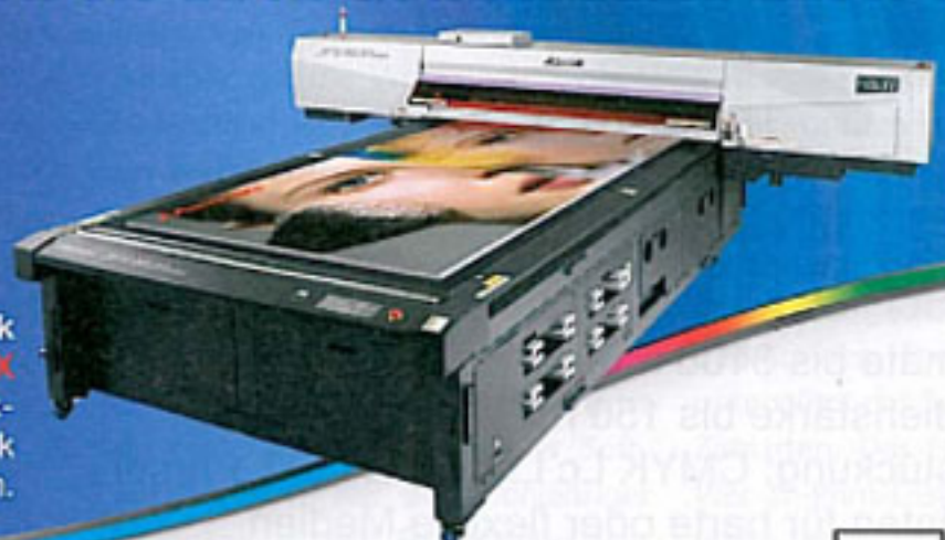
Großformatiger Digitaldruck ESC - Mimaki JFXplus UV LED Druck für noch höhere Geschwindigkeit, noch mehr Flexibilität und Präzision.

viscom düsseldorf 2011 Besuchen Sie uns! 13. - 15.10.2011 Stand 8a/E50