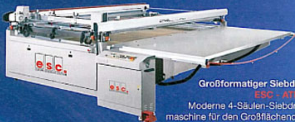
Großformatiger Siebdruck ESC - ATMAX Moderne 4-Säulen-Siebdruckmaschine für den Großflächendruck und höchste Anforderungen.